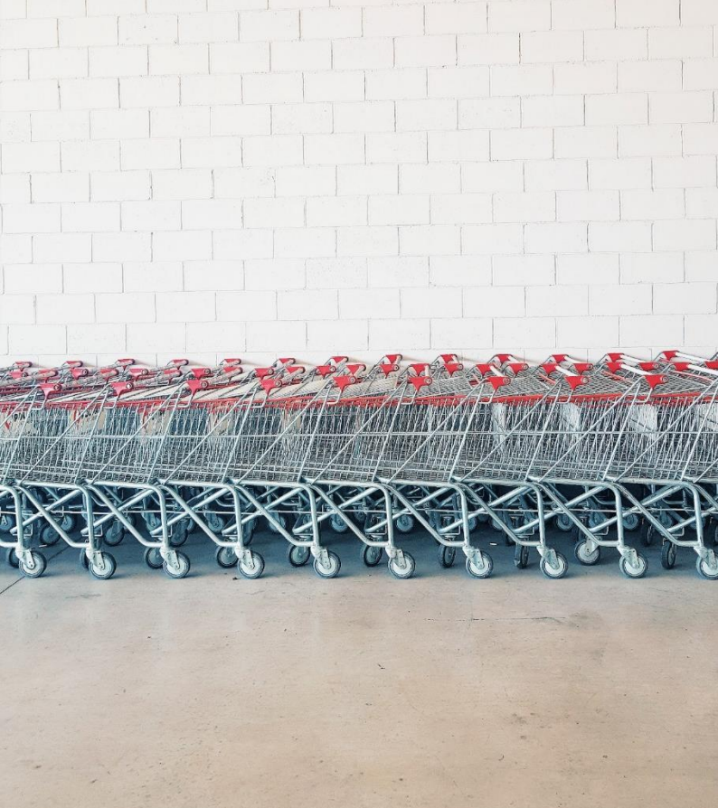
FAIRE DU SHOPPING