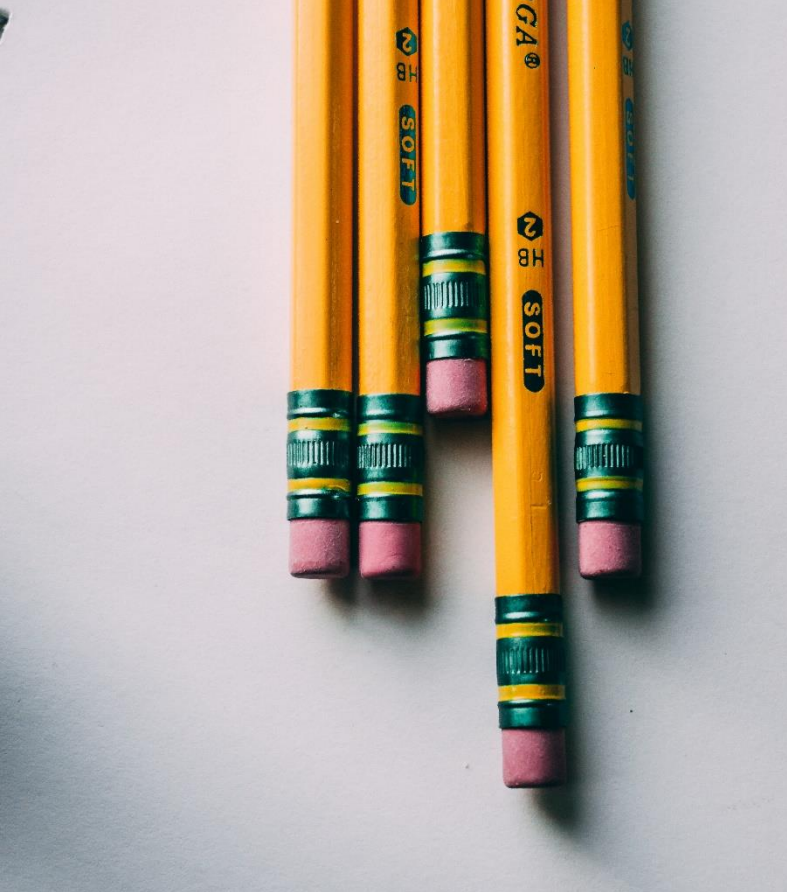
APPRENDRE, SE FORMER