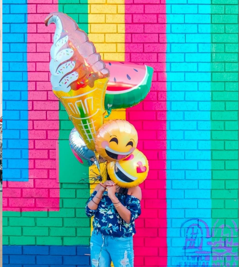
SE DIVERTIR, S'AMUSER