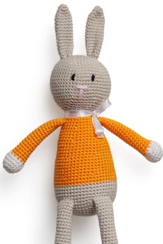
S'OCCUPER DES ENFANTS