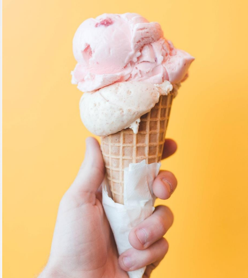
BOIRE ET MANGER